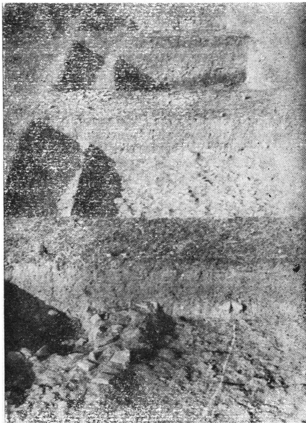
Fig. 4. Ovidiu, mun. de Constanța. La pavage principala à l'intérieur de la fortification.

În interiorul așezării, în imediata vecinătate a curții de est deci, au fost culese următoarele informații: