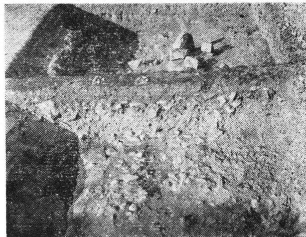
Fig. 3. Ovidiu, municipiu Constanța. Careurile H 1 și H 2 din vecinătatea curtinei de est.

În careul H 1 , din acest an, incinta prezintă urmele unei demantelări puternice, pînă la nivelul patului de așteptare. Încercarea de a obține date despre fundație n-a dat roade, nici în